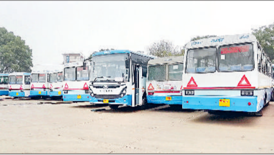
नारनौल। रोडवेज कर्मशाला में खड़ी रोडवेज की नई बसें।

इंश्योरेंस होने के बाद नई बसें की पासिंग अब भी बाकी है। गत बुधवार 24 जनवरी को पासिंग का दिन निर्धारित किया था, लेकिन उस दिन रोडवेज की हड़ताल होने तथा आरटीए के एमवीआई नहीं होने एवं