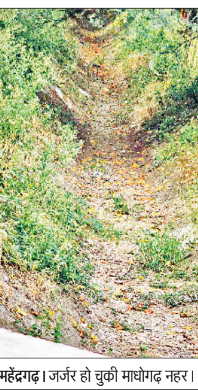
महेंद्रगढ़। जर्जर हो चुकी माधोगढ़ नहर।