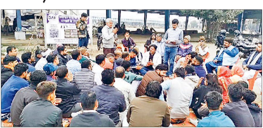
मंडी अटेली। बैठक में हिस्सा लेते क्षेत्र के लोग।

अटेली क्षेत्र के लोगों ने रविवार को मंडी अटेली अनाज में युवाओं के आह्वान पर एक सभा का आयोजन किया। जिसमें क्षेत्र के बच्चे, खिलाड़ी, कोच, समाज सेवक, अध्यापक, बुजुर्ग और मातृशक्ति शामिल हुए। सभा का मुख्य उद्देश्य अटेली क्षेत्र में खेलों की सुविधाओं को लेकर था। क्षेत्र के लोगों ने तथ्यों के आधार पर बताया कि किस तरीके से पूरे दक्षिणी के साथ मुख्य तौर पर खेल सुविधाओं में भेदभाव होता आ रहा है। हमेशा से और यहीं कारण है कि हमारे क्षेत्र के बच्चे शारीरिक रूप से इतना सक्षम होने के बावजूद भी आगे नहीं बढ़ पा रहे हैं।