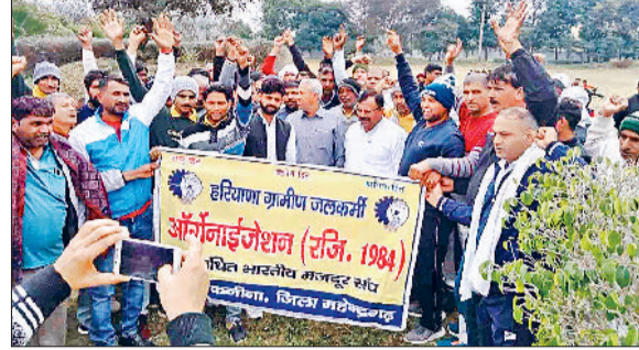
महेन्द्रगढ़। सरकार के प्रति नारेबाजी करते हुए।