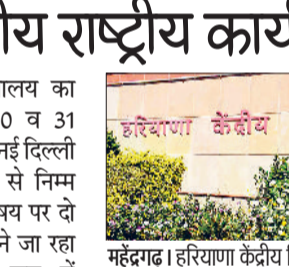
महेंद्रगढ़। हरियाणा केंद्रीय विश्वविद्यालय का मुख्यालय।