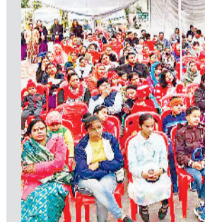
महेंद्रगढ़। कार्यक्रम में उपस्थित अभिभावक।