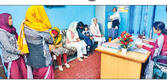
महेन्द्रगढ़। मीटिंग में उपस्थित अभिभावक।