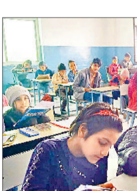
नारनौल। परीक्षा में भाग लेते विद्यार्थी।