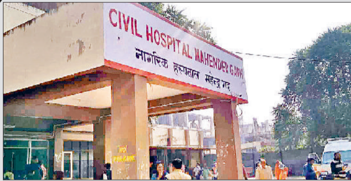
महेंद्रगढ़। नागरिक अस्पताल का भवन।

बता दें कि वर्ष 2019 में क्षेत्र के लोगों की मांग को ध्यान में रखते हुए सरकार द्वारा उप नागरिक अस्पताल में दर्जा बढ़ाकर महेंद्रगढ़ नागरिक अस्पताल का दर्जा दिया था। इसके बाद बेहतर सुविधाओं के लिए भवन का अभाव नजर आने लगा तो नए भवन के लिए 26 करोड़ रुपये के बजट को मंजूरी मिली। 10 जुलाई 2021 को नए भवन निर्माण का शिलान्यास का काम शुरू किया गया। महेंद्रगढ़ के नागरिक अस्पताल में सुविधाएं नहीं होने के कारण खंड के 65 गांव की करीब 5 लाख की आबादी को निजी अस्पताल से महंगी स्वास्थ्य सुविधा लेने को मजबूर हैं। इसके अलावा आमजन को नागरिक अस्पताल के लिए भी अमी लंबा इंतजार करना पड़ सकता है। वर्तमान में भवन के निर्माण कार्य तेजी के साथ चल रहा है। वहीं नागरिक अस्पताल में बनने वाले ऑक्सीजन प्लांट का कार्य शुरू हो चुका है।