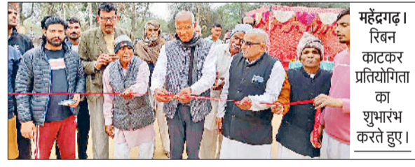
महेंद्रगढ़। रिबन काटकर प्रतियोगिता का शुभारंभ करते हुए।